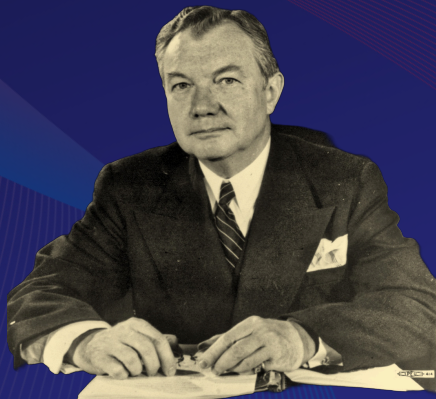
Fiscal Robert Jackson en su Teoría del Caso en los Juicios de Nuremberg.

“Las atrocidades que tratamos de juzgar y castigar fueron tan inimaginables, tan malvadas y de tan devastadoras consecuencias que la civilización humana no puede permitir que queden sin respuestas, pues no sobreviviría a la repetición de tal atrocidad.