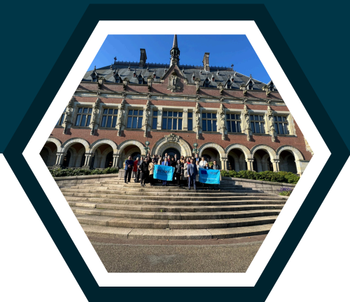
La Haya Países Bajos

El curso inicia en Ginebra, Suiza, la sede de los órganos de protección de derechos humanos de Naciones Unidas , donde se tendrá la oportunidad de visitar oficinas y secretarías de dichos órganos. Posteriormente, nos trasladaremos a Estrasburgo, Francia, donde visitaremos el Tribunal Europeo de Derechos Humanos y el Parlamento Europeo . Continuaremos con una visita al campo de concentración de Dachau , los Tribunales de Nuremberg y el museo de documentación Nazi en Nuremberg, Alemania. Finalmente, viajaremos a La Haya, Países Bajos, donde tendremos la oportunidad de visitar la Corte Internacional de Justicia y la Corte Penal Internacional .